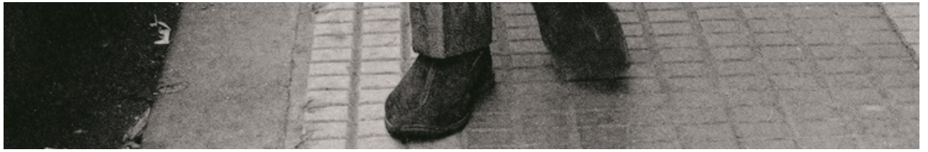
David Lamelas, circa 1967